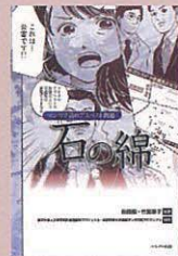
*書籍の写真はイメージです。