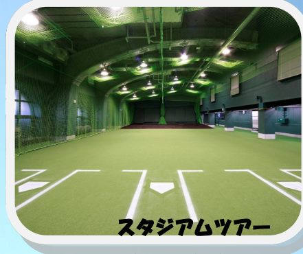
スタジアムツアー